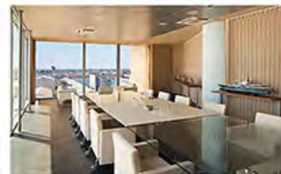
На фото Все производственные мощности и офисы верфи Tankoa расположены в предместье Генуи – в историческом центре итальянского судостроения.