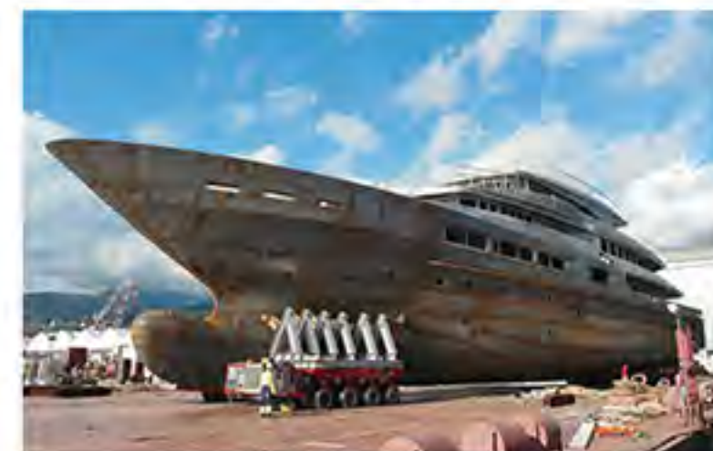
Вверху и внизу Проект 50-метровой яхты линейки S501.

внимание громкими заявлениями в прессе. Впервые они рассказали о себе и своей работе лишь в этом году, собрав большую прессе-конференцию во время яхт-шоу в Монако. Именно там мировая яхтенная пресса увидела новый имидж Tankoa и проекты яхт, которые скоро (надемся) появятся на ее страницах. Яхты Tankoa будут строиться на трех основных платформах: 50-54 м, 65-70 м и 80-88 м. Первая линейка, получившая название S501, будет включать в себя два варианта корпусов – водоизмещающий S501D ( Displacement ) и скоростной