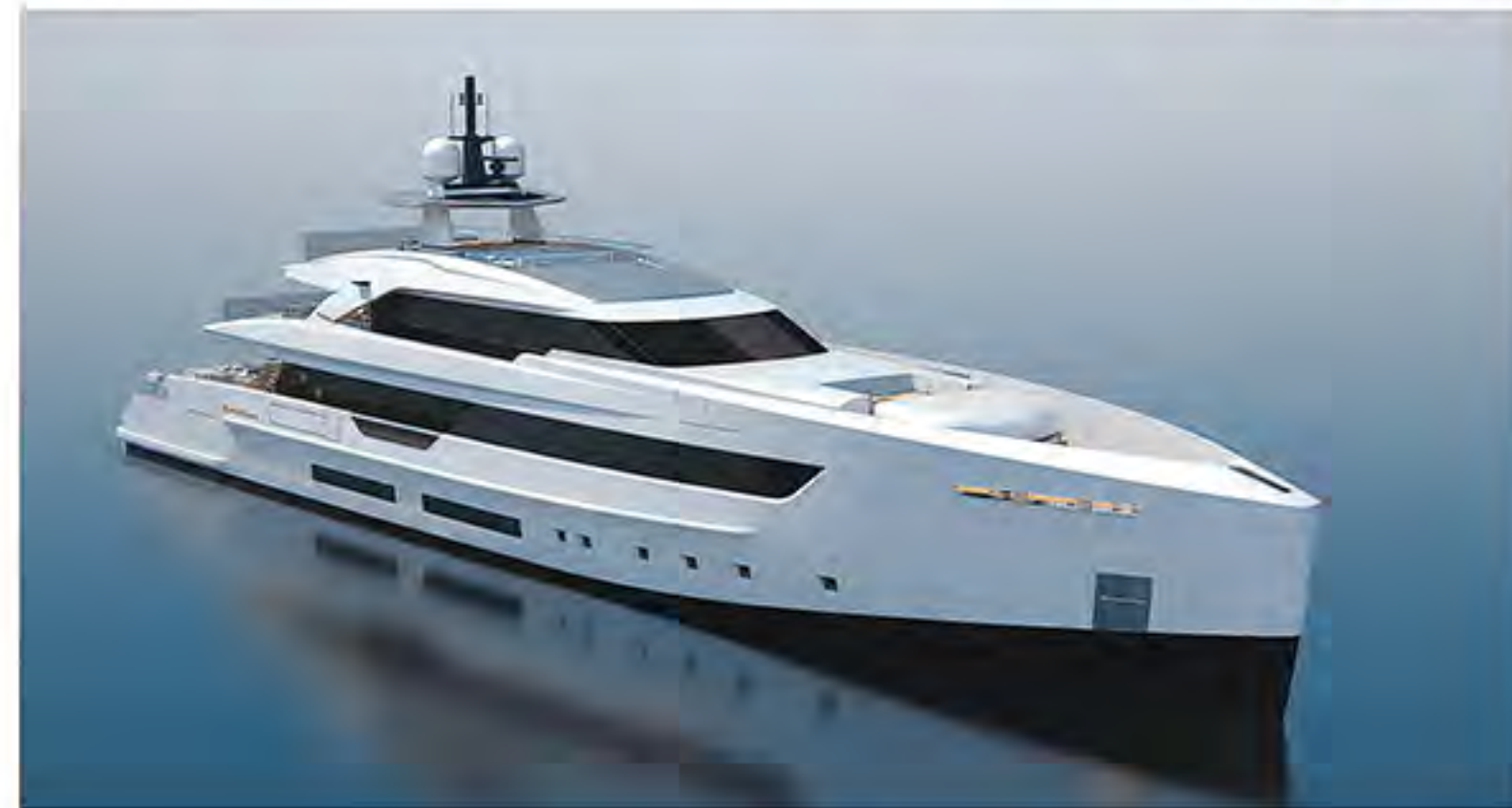
Справа Яхта под проектным номером S693 уже находится в завершающей стадии строительства.