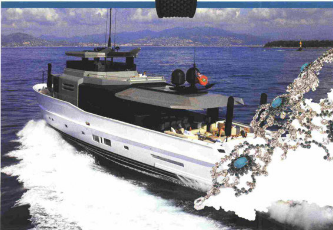
Chantecler Capri Arcadia 100.

► TWENTY-EIGHT BRANDS HOSTED IMPORTANT MARINE SHIPYARDS AND FAMOUS YACHT CLUBS IN THEIR BOUTIQUES. The initiative is sponsored by the Associazione MonteNapoleone, which represents 140 Luxury