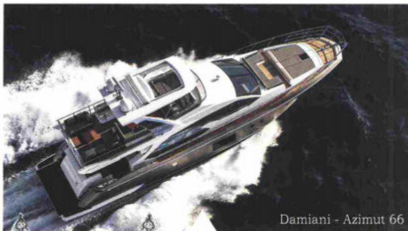
Damiani - Azimut 66