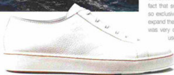
Perini Picchiotti - Vhernier