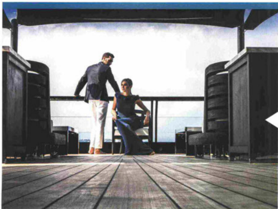
Audemars Piguet - Crn Atlante