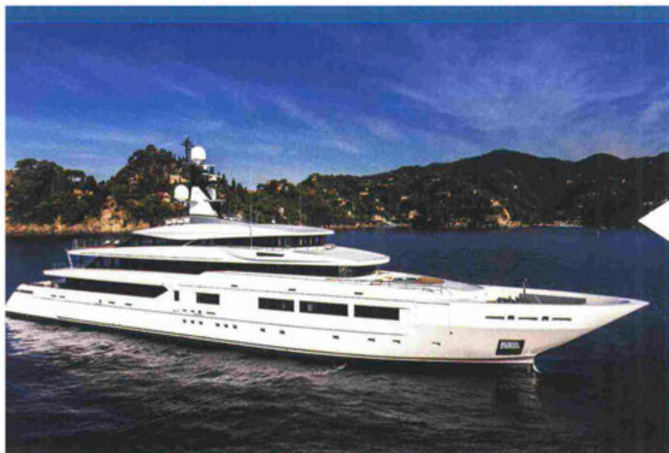
Tankoa 693 - Falconeri