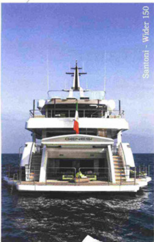
Santoni - Wider 150