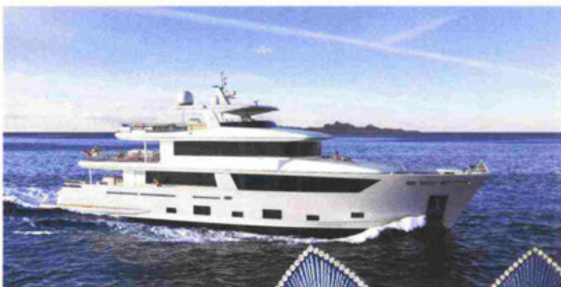
Cdm Nauta Air 108 - Sabbadini

linked because real luxury today means doing things with passion, but above all with a profound knowledge of the product that you are creating; to make truly high quality products, it takes time, and this in turn limits the number of products you can make; whether a yacht, a watch or a hand tailored suit, you need a lot of time, knowledge and passion. We asked ourselves if there is no contradiction between the fact that some brands tend to make their work so exclusive, and the need for luxury brands to expand their consumer base. On this point, Miani was very clear: «The world of the sea is often used, seen and experienced by fashion, luxury and premium watch brands as an element capable of adding value and playing up the qualities and performance of the products