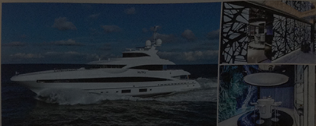
„MySky“: Heesen lieferte mit der 51 Meter langen „MySky“ ein Format aus ihrer Verdränger-Linie ab. Das Exterior gestaltete Frank Laupmann von Omega Architects, für das zeitgenössische Interior engagierte der Eigner den niederländischen Architekten Erick van Egeraat.

Heesen gibt die Ablieferung der 51 Meter langen „MySky“ bekannt. Der 529 Tonnen verdrängende Stahl-Alu-Bau entstand nach Plänen von Omega-Architects-Designer Frank Laupmann gemäß Lloyd's-Register-Vorschriften, das ultramoderne Interior stammt aus den Rechnern des renommierten niederländischen Architekten Erick van Egeraat, der mit „MySky“ seine Yachtpremieren feiert. Auf vier Decks dominiert eine aufregende Materialmischung, bestehend aus strahlend weißem Leder, dunklem Makassar-Ebenholz und schwarzem Marmor mit imposanten Hintergrund-beleuchteten Onyx-Einlagen. Zwei MTU-Diesels mit je 1380 Kilowatt Leistung sorgen für eine Geschwindigkeit von maximal 15,6 Knoten, die Reichweite beträgt 3200 Seemeilen bei zwölf Knoten. heesenyachts.com