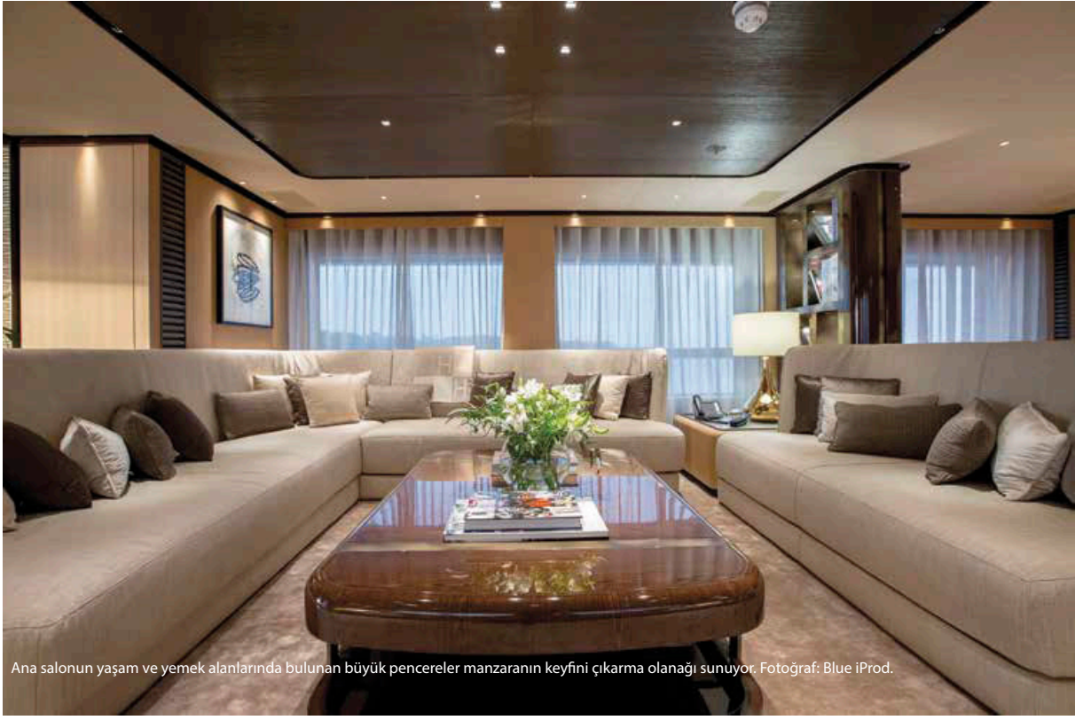
Ana salonun yaşam ve yemek alanlarında bulunan büyük pencereler manzaranın keyfini çıkarma olanağı sunuyor.

Tankoa Yat tarafından hayata geçirilen Vertige, 2017 Dünya Yat Ödülleri Dış Tasarım Ödülü sahibi. 50 metre uzunluğundaki yatın dış ve iç mekan tasarımı Francesco Paszkowski imzasını taşıyor. Sahibinin isteği doğrultusunda aile hayatının tüm gerekliliklerine karşılık verebilecek kapasitede üretilen yat, iş toplantıları ve charter için de kullanılabilir.