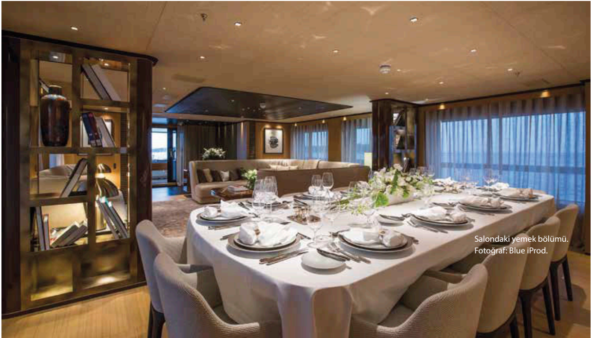
Salondaki yemek bölümü.

ekibi ve Margherita Casprini işbirliği ile tamamlanmış. Konukların tüm ihtiyaçları göz önüne alınarak özelleştirilen iç mekanlar, sakin ve konforlu bir atmosfere sahip. Yat pürüzsüz ve sağlam gövde kombinasyonu, 1000hp MTU motorlarını ve Vosper Naiad hız stabilizatörleri sayesinde sessiz ve titreşimsiz bir yolculuk sunuyor. Denizle iç içe bir görsellik yaratmak adına yüksek ve geniş pencereler tercih edilmiş. İç meknlarda tercih edilen koyu renk gül ağacı, 1950'lerin tasarımlarının sofistike ve modern yorumlarını yansıtıyor. 14 kişilik konuk kapasitesi sahip ana güvertede, kanepeler, şezlonglar ve UV ışınlarını filtreleyen tenteler bulunuyor. Üst güvertede ise 14 kişilik yemek masasına yer verilmiş. Açık havada film seyretmek isteyen konuklar için, 65 inch