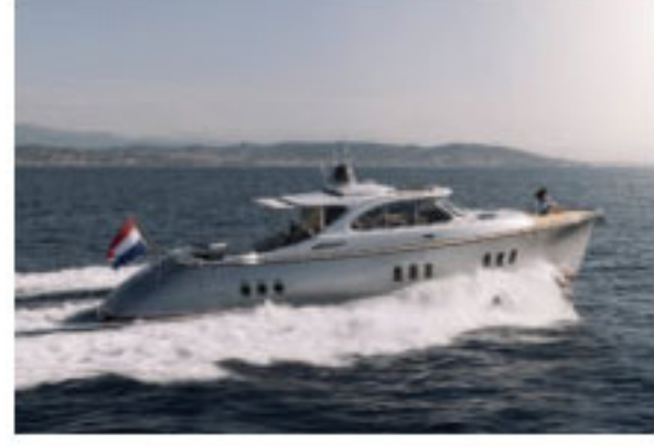
Zeelander Yachts, 2018'de yeni tesis ve yeni modeli duyurdu