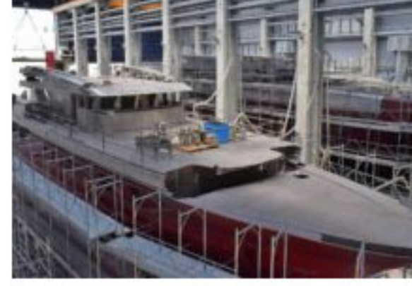
İkinci Baglietto T-Line 48 tamamlanmaya yaklaşıyor