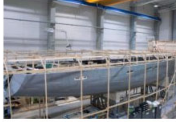
Baltic 85 Custom Yelkenli biçimi alıyor