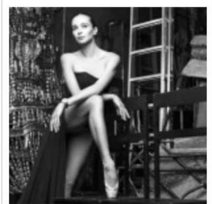
Diana Vishneva devient ambassadrice Jaquet Droz.