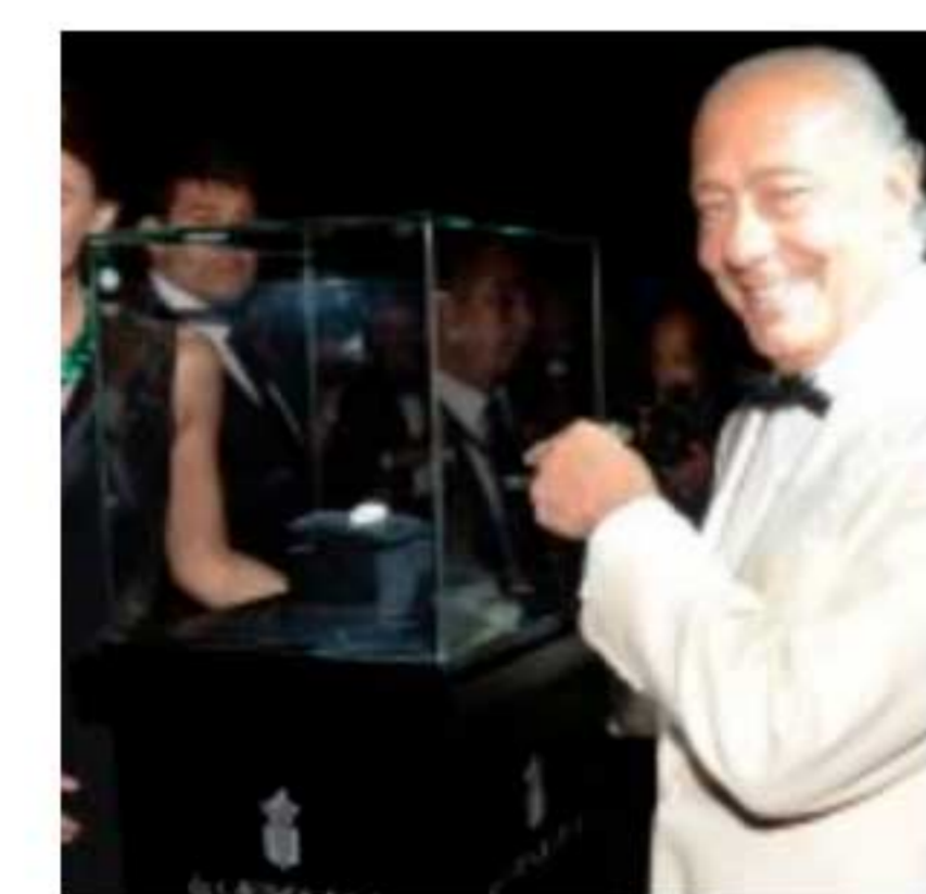
Les Folies de Grisogono à Cannes.