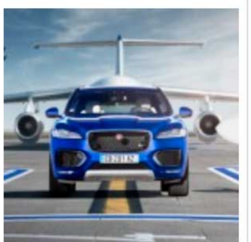
La Jaguar F-Pace vue par Dingo.