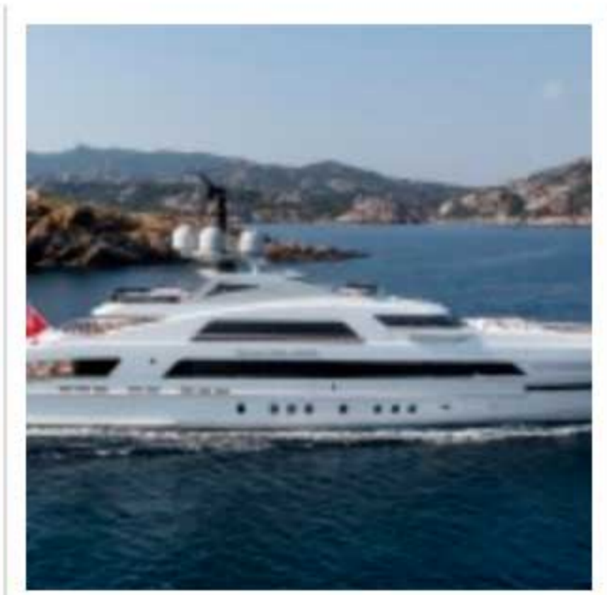
Heesen Yachts : 3 récompenses au Monaco Yacht Show 2013.