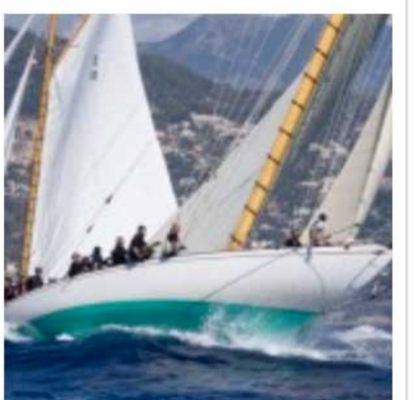
Monaco Classic Week 2017.