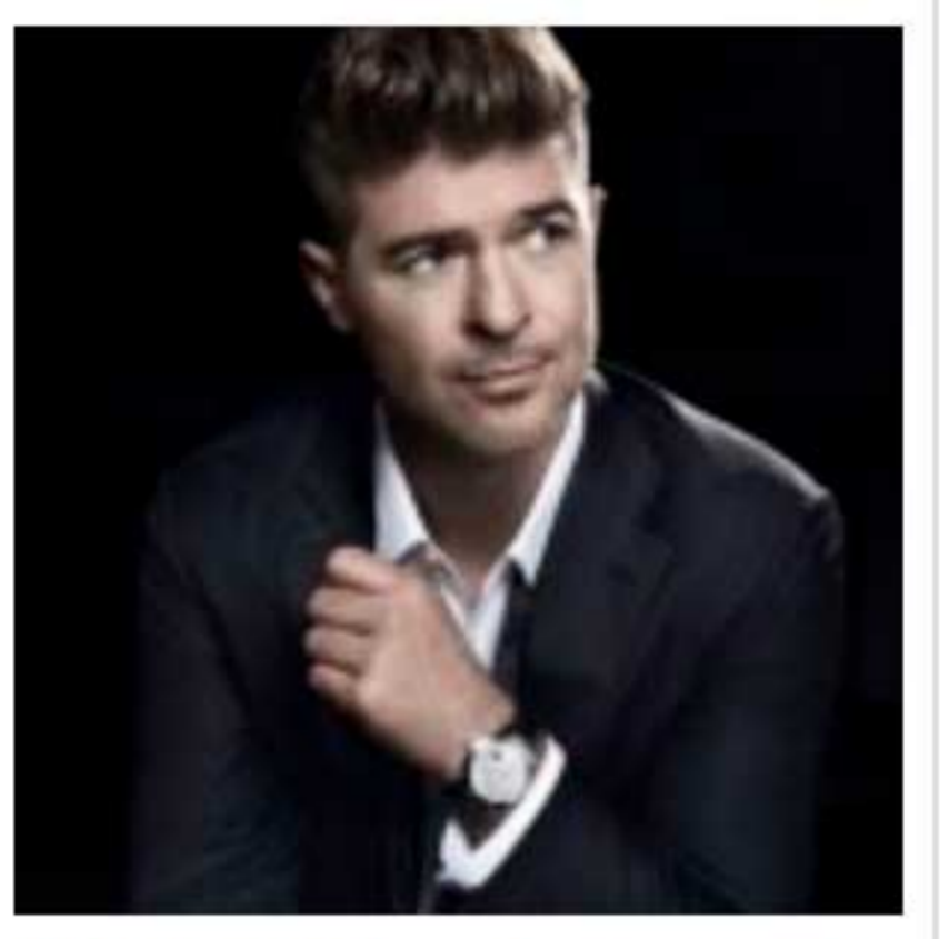
Robin Thicke : Le nouvel ambassadeur d'Harry Winston Horlogerie.