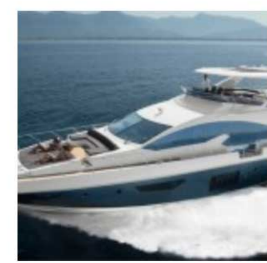
Azimut 80 en première mondiale au Festival de la Plaisance 2013.