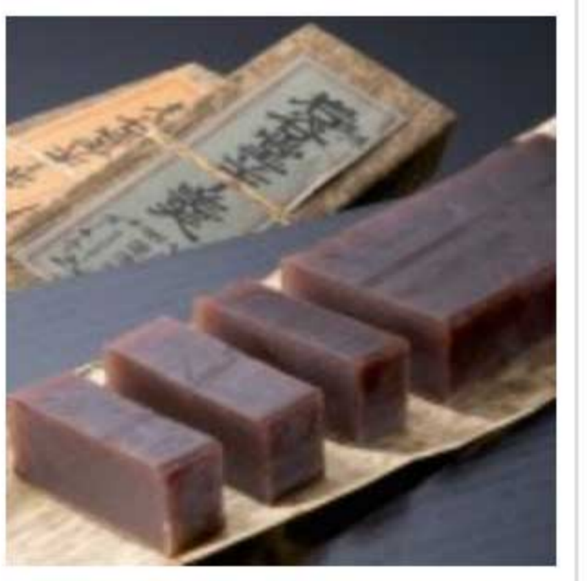
Yokan Collection in Paris.