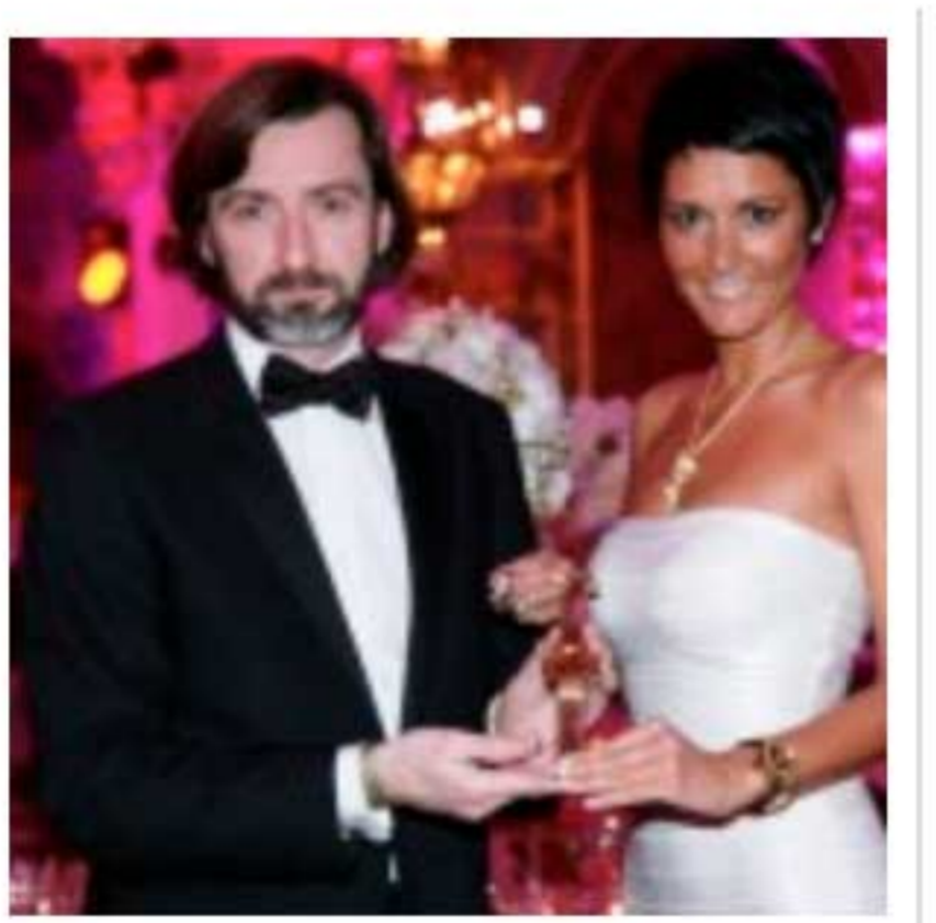
Hublot lance l'or jaune !